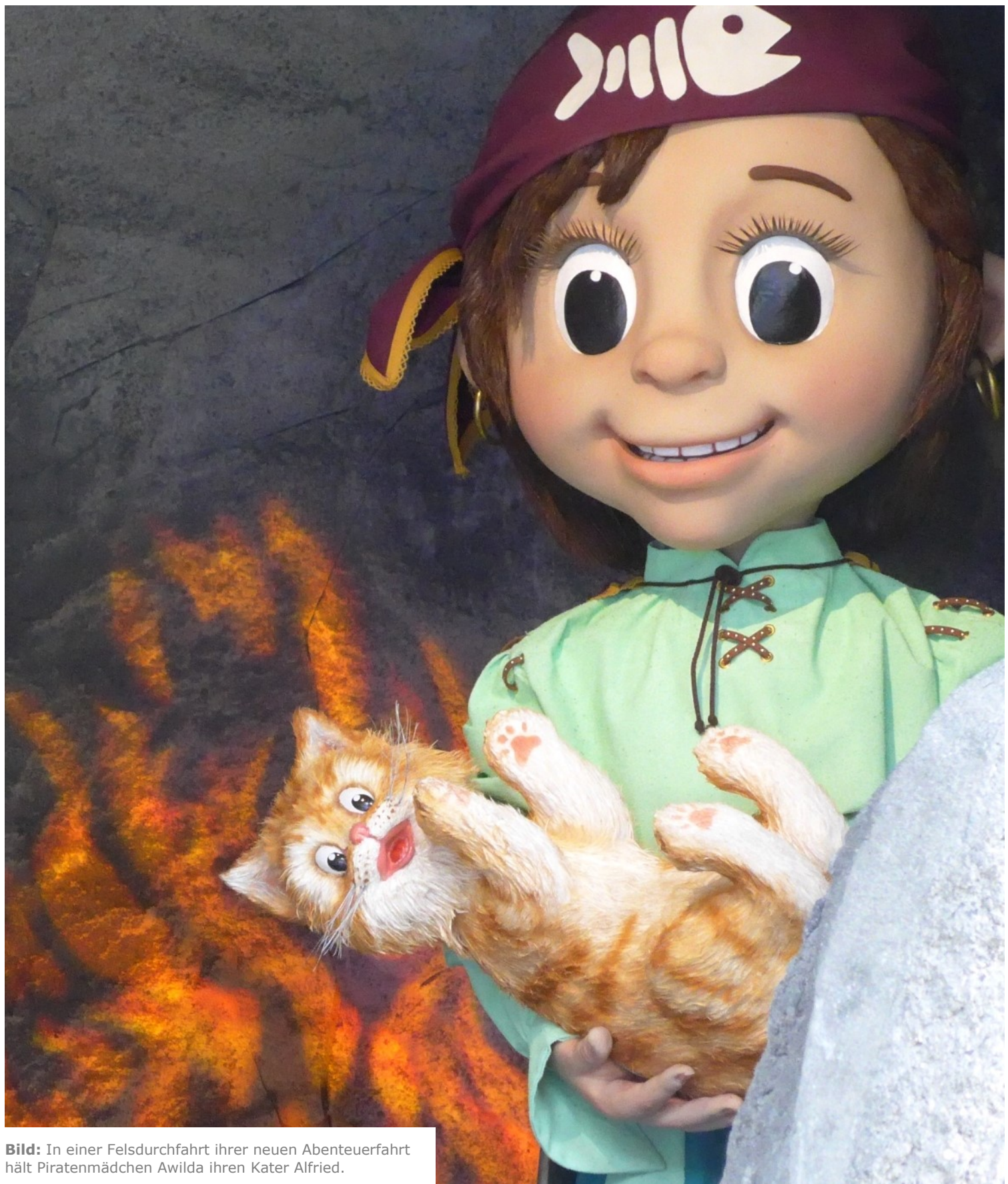
Bild: In einer Felsdurchfahrt ihrer neuen Abenteuerfahrt hält Piratenmädchen Awilda ihren Kater Alfried.